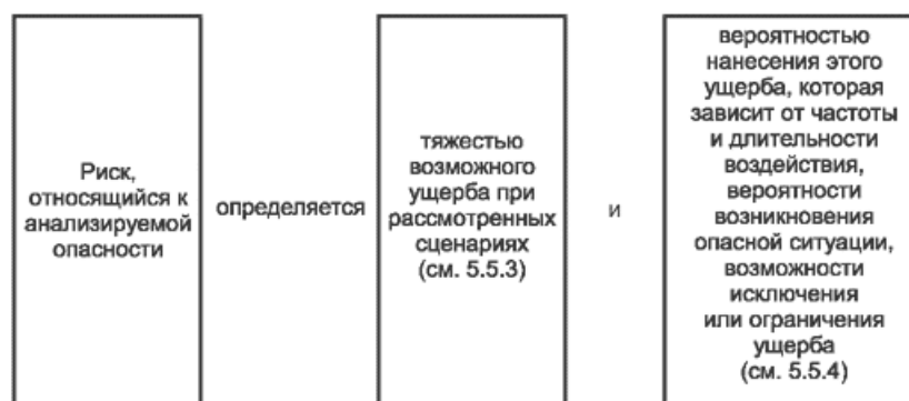
Рисунок 3 - Риск и его составляющие

Более подробно о составляющих риска и о процессе определения уровня тяжести возможного ущерба и уровня вероятности возникновения такого ущерба изложено в 5.5.3 и 5.5.4 соответственно.