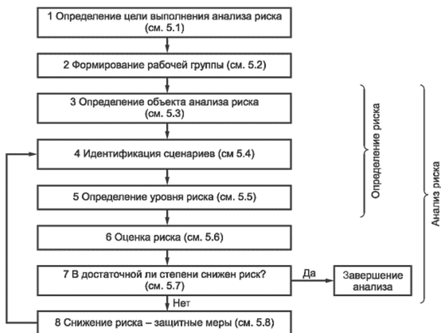
Рисунок 1 - Схема выполнения анализа и снижения риска